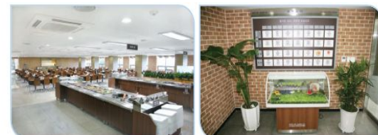
〈 카페테리아 전경 〉