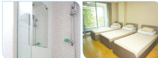
〈 기숙사(숙소) 전경 〉